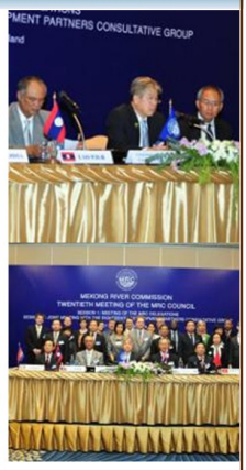
Infographic by: กศย.ศศย.สพท.